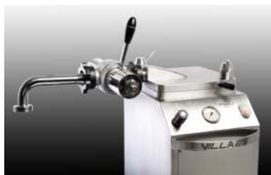
Dosificateur (option) / Dosing device (option)

Dosificateur (en option) : transforme la machine en véritable doseuse de 20 à 500 grammes.