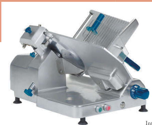
Interrupteurs IP 67

Cet appareil est équipé de bagues de coulisseau spécifiques assurant une souplesse et une douceur de mouvement quelque soit le poids de la marchandise posée sur le plateau.